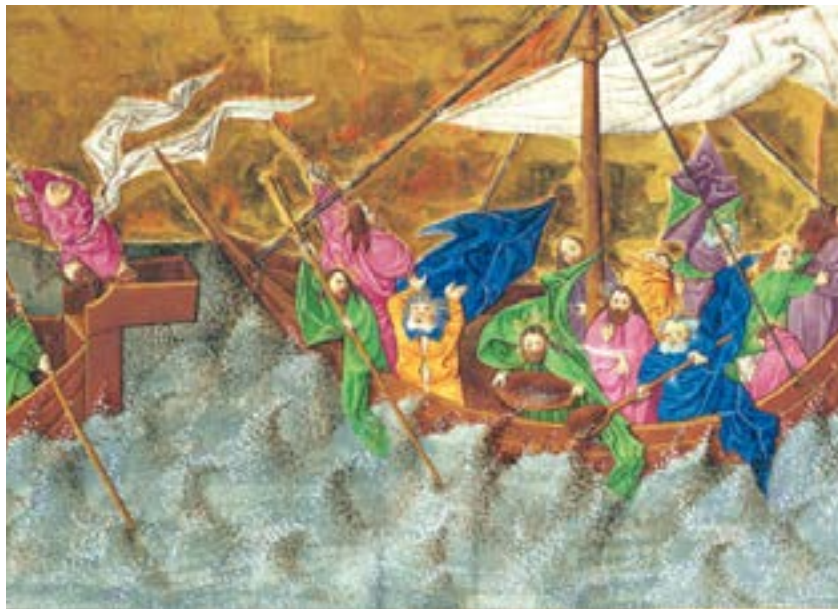
rpi -ekkw-ekbn.de.Ottoheinrich-Bibel Blatt 501

„Ja, genau“, pflichte ich ihr bei. „*Überall flüchten und verhungern Menschen, vor allem auch Kinder. Lass uns die Hände in den Schoß legen. Man kann ja eh nichts machen.“ sage ich und seufze. „Das hat keiner der Propheten jemals gesagt!“ Sie funkelt mich an und springt mir fast ins Gesicht. „Willst Du mich auf den Arm nehmen?“