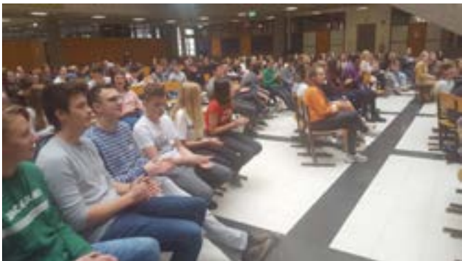
Konfis in Wörgl