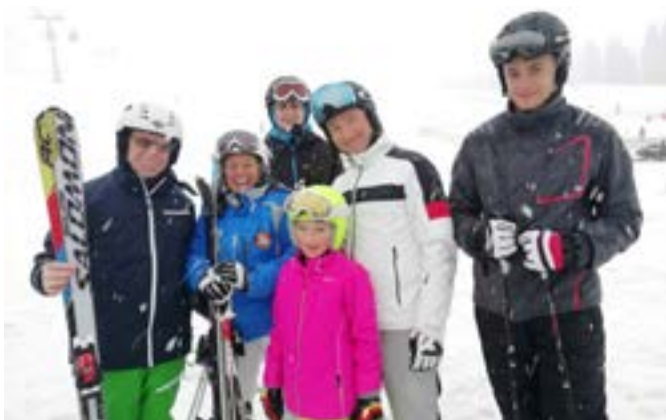
Skifahrer beim Skitag St. Johann

Einige Hartgesottene fanden sich zum Skitag in St. Johann ein. Gemütlich wurde es am Nachmittag bei Kaffee und Kuchen, einem Quiz und lustigen Gesprächen. Vielen Dank an alle Organisatoren.