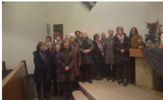
Weltgebetstag der Frauen 2020