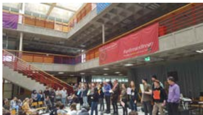
Dunja Ascari stellt ihr Projekt vor