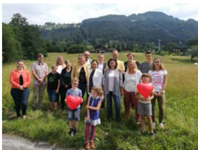
Familiengottesdienst mit Verabschiedung der alten GV