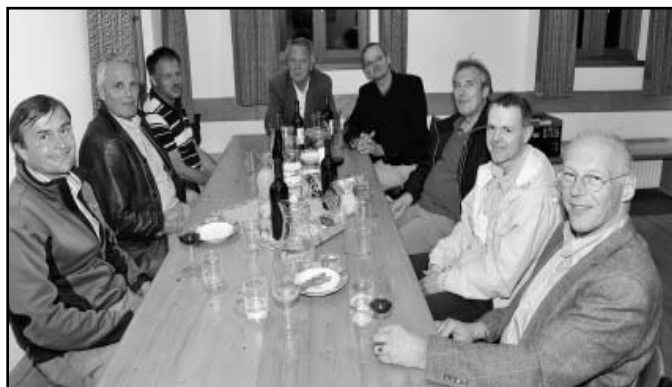
lustige Männerrunde bei einem gemütlichen Glas Wein

Vor ca. 5 Jahren trafen sich drei evangelische Frauen und vier Kinder bei Kaffee und Kuchen mit dem Ziel, eine evangelische Krabbelgruppe zu gründen. So etwas ist immer eine heikle Sache, wenn wildfremde Menschen zusammenkommen. Aber sie waren sich auf Anhieb sympathisch und schafften es tatsächlich sich alle 2 Wochen zu treffen. Mit der Zeit kamen weitere Mütter mit Kindern dazu. Einige waren nur sporadisch dabei, andere kamen regelmäßig. Der harte Kern von fünf Frauen blieb. Und wie sollte es anders sein, es kam auch noch Nachwuchs dazu. Mittlerweile sind die Kinder zwischen 2 und 10 Jahren alt und wenn alle da sind, geht es ganz schön rund. Und nach wie vor gibt es regelmäßige Treffen. Oft werden auch spontan Ausflüge beschlossen, wie gemeinsames Rodeln, Langlaufen, ein Ausflug ins Schwimmbad oder Freilichtmuseum Großmain. Ab und zu sind dann auch die Papa's mit. Dann macht es natürlich umso mehr Spaß. Vor zwei Jahren haben die Mamas auch mal beschlossen, dass sie ganz dringend eine Auszeit benötigen und fahren für ein Wochenende nach Verona. Die Erlebnisse werden wohl noch lange in Erinnerung bleiben.