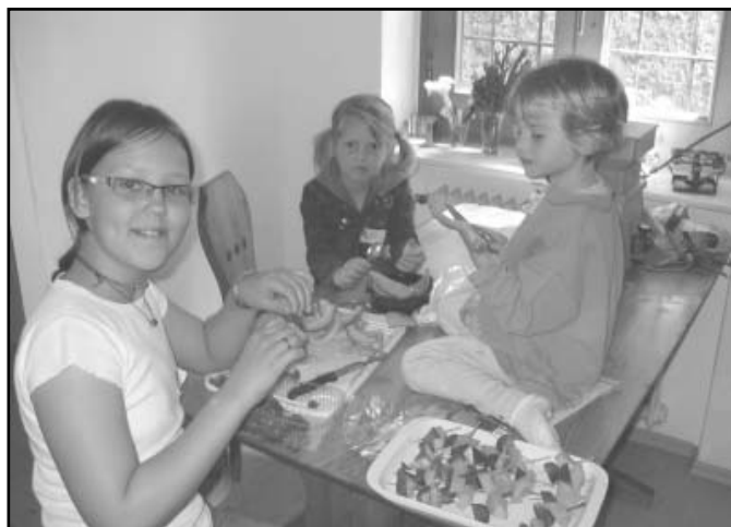
beim Kinderkirchentag gibt es viel zum Staunen, Lachen und Kosten

Alle Kinder ab ca. 4 Jahre sind herzlich eingeladen mit uns zu spielen, singen, kochen und basteln. Wir freuen uns auf Dein Kommen!