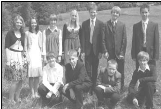
"Churchies" - die KonfirmandInnengruppe 2009/2010

Der Krabbelgottesdienst im Frühsommer fiel in diesem Jahr nicht ins Wasser - die von der Pfarrerin ebenfalls eingeladenen Kirchenmäuse feierten zur allseitigen Begeisterung mit den Krabbelkindfamilien einen kleinen feinen Gottesdienst, bei dem wirklich alle, auch die anwesenden Papas gern mitmachten.