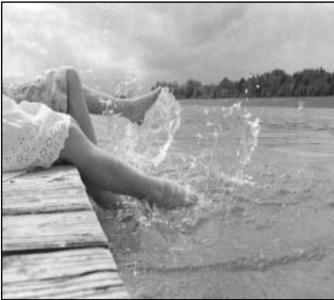
See oder Gottesdienst?