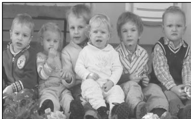
ein Foto aus "frühen Tagen" unseres Kinder-Solettkreis

Und weil aus der Krabbelgruppe mittlerweile eine Gruppe mit großen und kleinen Kindern geworden ist, wurden sie kurzerhand in "Solettis" unbenannt als kleine Erinnerung an das absolute Lieblingsessen. Je älter die Kinder werden, umso schwieriger ist es oft ein Treffen zu vereinbaren. Größere Kinder haben ja auch schon mehr Verpflichtungen. Aber irgendwie schaffen sie es nach zahlreichen Mails immer wieder ein Treffen zu organisieren. Auch am jährlichen Kinderkirchentag ist der Solettkreis zahlreich vertreten. Was uns sonst noch auszeichnet: das Vertilgen von Unmengen an Kuchen und Solettis und natürlich viel Action.