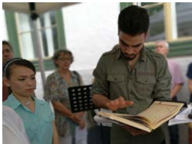
Friedensgebet St. Johann