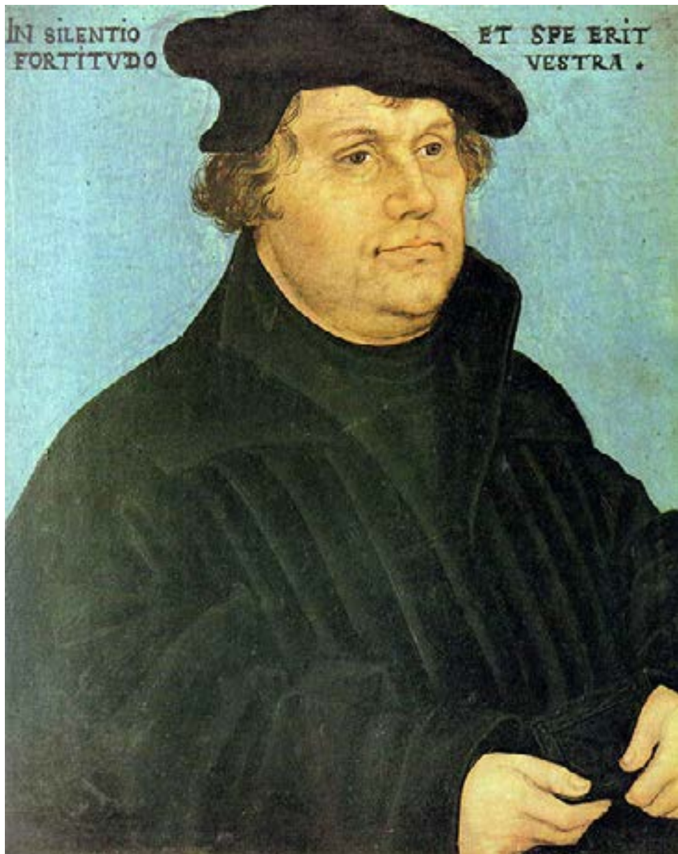
Martin Luther 1528 gemalt von Lukas Cranach d. Älteren