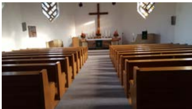
Neuer Teppich in der Christuskirche