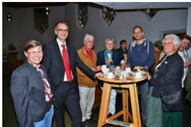
Nette Stimmung beim Kirchenkaffee