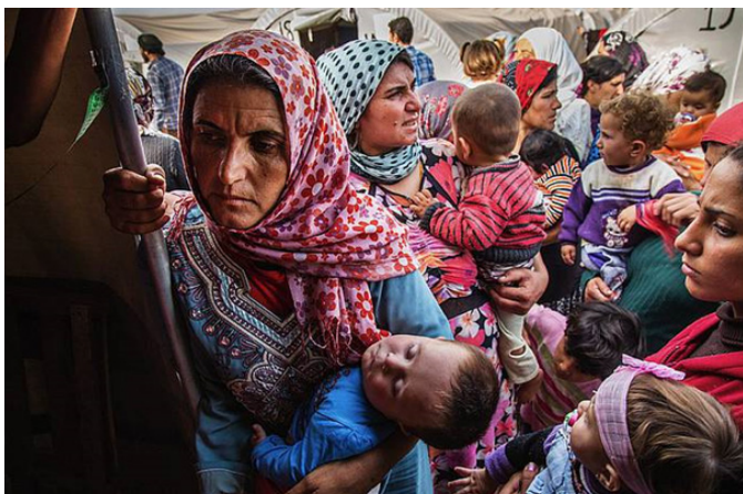
Mütter mit Kindern nach ihrer Ankunft im Flüchtlingscamp in Suruc (Türkei).

5 funktionstüchtige Herrenräder, 1 Fernsehgerät, Kontakt: Edwin Veldt, Tel.: 0676 8850 882437